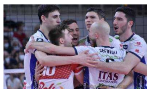
Champions League, Perugia cede 17-15 al golden set: è di nuovo Finale per la Trentino Itas