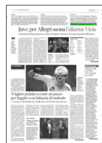
Superficie 1 %

ARTICOLO NON CEDIBILE AD ALTRI AD USO ESCLUSIVO DEL CLIENTE CHE LO RICEVE - 4