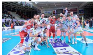
L'itas Trentino supera 3-0 Piacenza in gara 3 dei quarti di finale e guadagna l'accesso alla Semifinale Play Off con la Lube