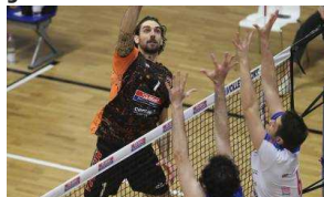
Il Ks Rent Bolghera soffre, ma vince al quinto e blinda la salvezza