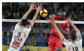
Pasquetta alla BLM Group Arena per gara 2 della serie di Semifinale Play Off Scudetto 2022