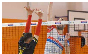
Per il Bolghera sabato al PalaClarina sfida chiave contro il Cazzago