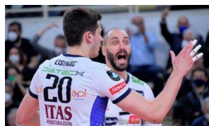
Play Off Scudetto, domenica alla BLM Group Arena lo spareggio dei quarti con Piacenza