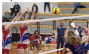
Domani l'ultima in casa dell'Argentario: arriva il Lemen