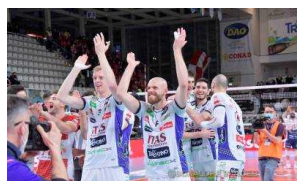
Play Off Scudetto 2022, l'itas Trentino non smette di sognare: successo in tre set a Civitanova Marche in gara 1 di Semifinale