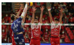
Play Off, Piacenza vince in rimonta gara 2 dei quarti e riporta la serie a Trento