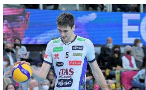
Giovedì a Civitanova Marche (ore 20.30) via alla serie di Semifinale Play Off Scudetto 2022: la guida a gara 1 Cucine Lube-Itas Trentino