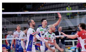
Champions League, giovedì alla BLM Group Arena (ore 20.30) la semifinale di ritorno