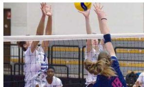
Anche il Lemen sbanca il PalaBocchi, Argentario battuto 3-1