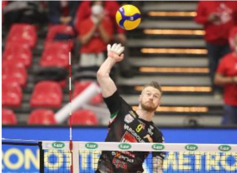
Il martello biancorosso Ivan Zaytsev

ARTICOLO NON CEDIBILE AD ALTRI AD USO ESCLUSIVO DEL CLIENTE CHE LO RICEVE - 4